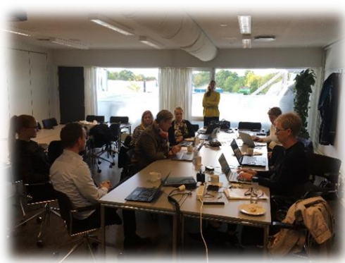
Arbejdsgruppen kommenterer og kommer med forslag....

Redaktion: Ebbe Schou Hargbøl og Lajla Pedersen