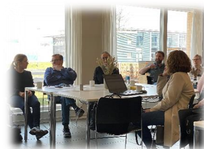
Der diskuteres og erfaringsdeles ivrigt.

Årsmødets 'fra vores egen verden' rummede, foruden de to oplæg, ESB-netværkets aktivitetsberetning, fremlæggelse af regnskab 2019 og budget 2020. Både beretning og økonomi blev vedtaget.